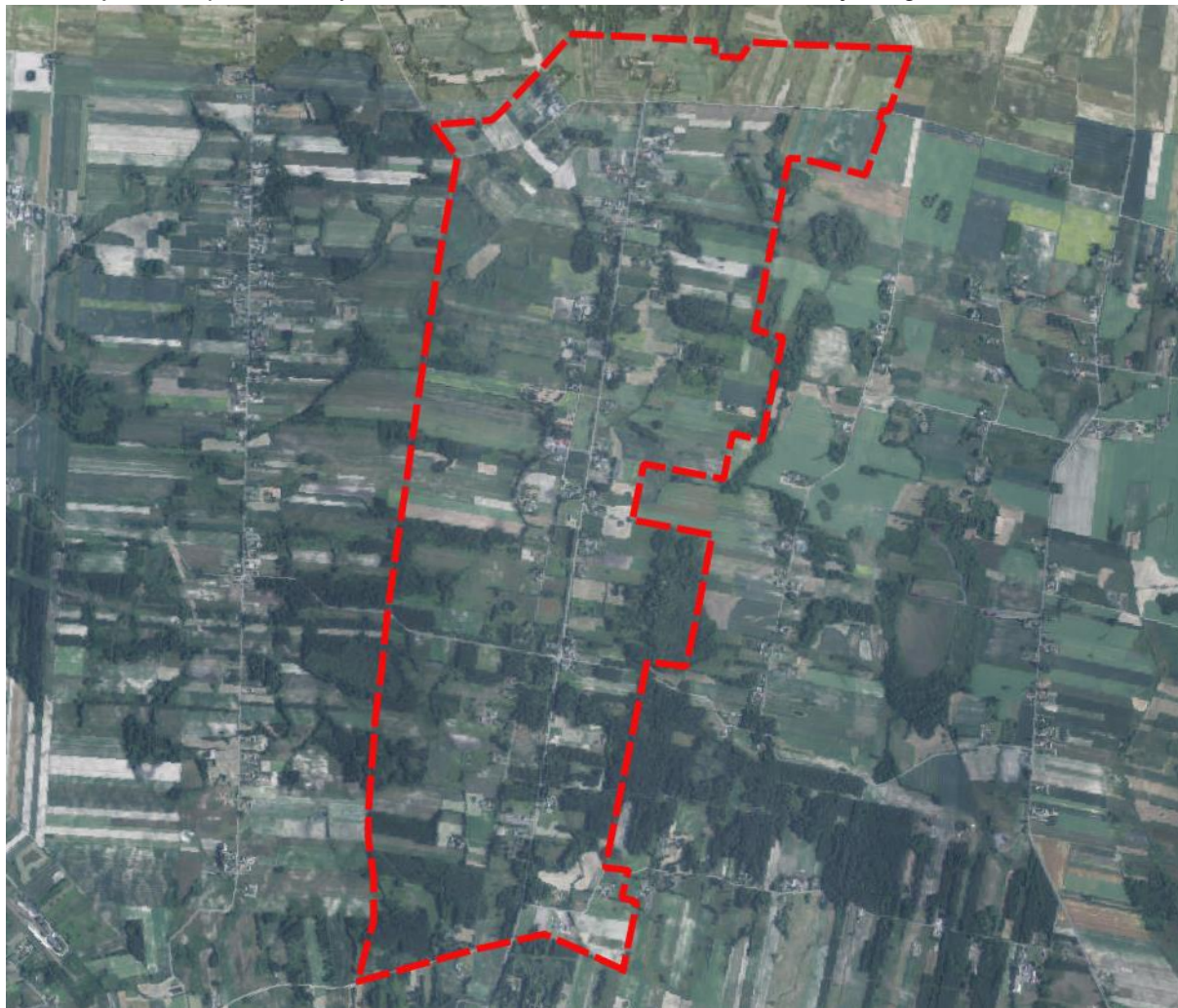
Rysunek 2 Położenie obszaru opracowania na ortofotomapie

W krajobrazie obszaru opracowania dominują tereny otwarte w formie nieużytków, łąk, pastwisk, pól uprawnych oraz skupisk zieleni wysokiej. Nieliczna zabudowa występuje głównie wzdłuż przebiegającej przez obszar opracowania z północy na południe drogi wojewódzkiej nr 838 klasy zbiorczej. Jest to przede wszystkim zabudowania mieszkaniowa, rzadziej usługowa.